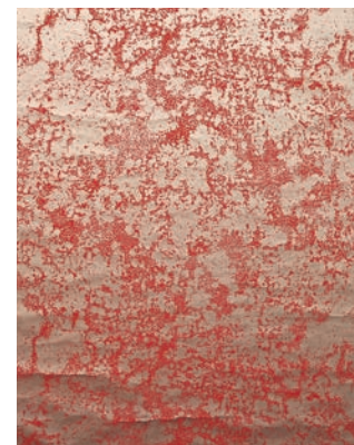
Hannas bit av den handtryckta tapeten Galaxy, designad av Florence Broadhurst.

– Min idol är en riktigt cool kvinna vid namn Florence Broadhurst. Hon föddes 1899 i Australien och var aktris och jetsettare. Men hon hade också en stor konstnärlig talang. När hon var runt 50 började hon att ta sitt konstnärskap mer på allvar. Ett antal år senare startade hon en tapetfirma och ritade de mest fantastiska mönstren. Det är verkligen synd att hon inte började tidigare. Jag har en bit av en av hennes handtryckta originaltapeter. Den är som en liten skatt. □