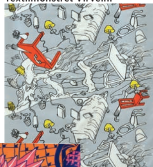
Slutsåld anteckningsbok som Carl Johan De Geer designat för Pocketshop.