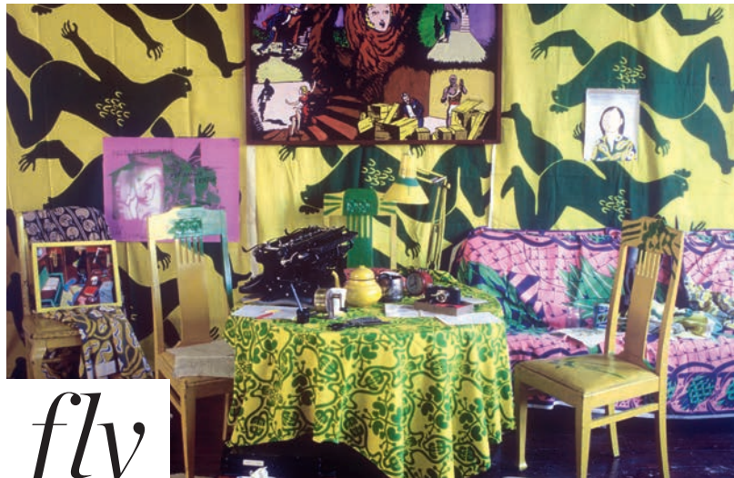
Detaljbild ur Carl Johan De Geers installation Gult rum från 1991.